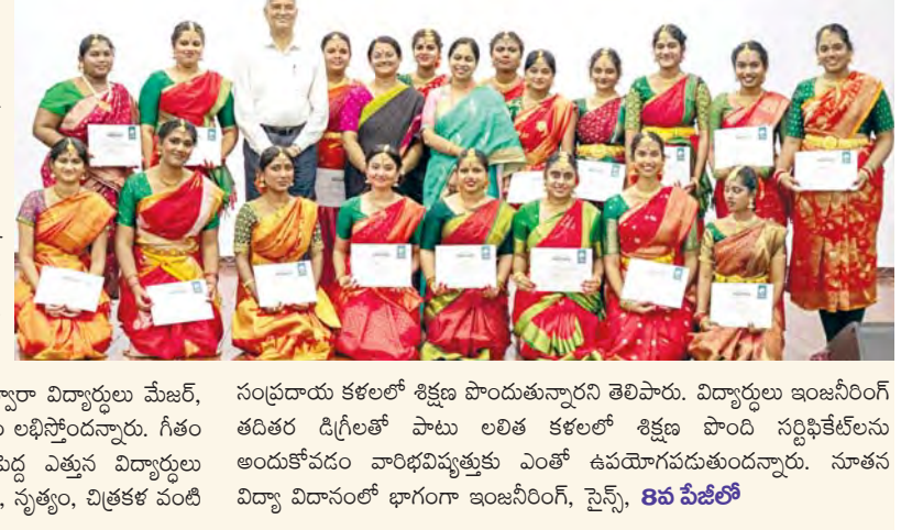
సంప్రదాయ కళలలో శిక్షణ పొందుతున్నారని తెలిపారు. విద్యార్థులు ఇంజనీరింగ్ తదితర డిగ్రీలతో పాటు లలిత కళలలో శిక్షణ పొంది సర్టిఫికేట్లను అందుకోవడం వారిభవిష్యత్తుకు ఎంతో ఉపయోగపడుతుందన్నారు. నూతన విద్యా విధానంలో భాగంగా ఇంజనీరింగ్, సైన్స్, 8వ పేజీలో