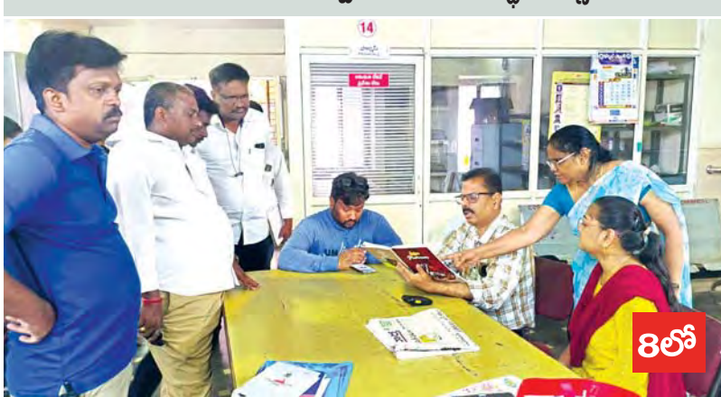
-ఏడు నెలలుగా జీతాలేని సిబ్బంది -రోగుల అవస్థలు వర్షాతీతం 8లో

మందులేవు...వైద్యం అందదు -కుక్క కాటుకు మందులు లేక బాధితులు ఆగ్రహం