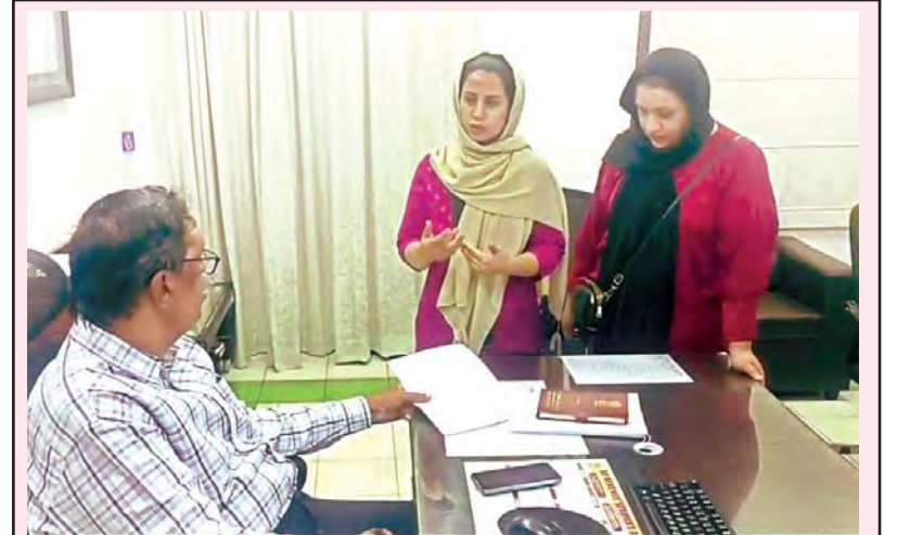
యద్దు నేపథ్యంలో ఏర్పడిన క్షిప్ర పరిస్థితుల కారణంగా జిల్లా రెవెన్యూ అధికారిని కలిసి ఫైనాన్షియల్ అసిస్టెంట్ కోలిన ఏయూలో ఫార్మా కోర్స్ చదువుతున్న ఇరాన్ విద్యార్థులు (విశాఖపట్నం-ప్రభాతవార్త)